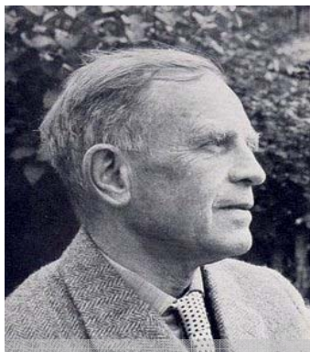
Wilhelm Röpke, "Más allá de la oferta y la demanda". Madrid, Unión Editorial, 1979.

"El hecho de que los hombres no adviertan muchas veces que presentan reclamaciones que sólo pueden satisfacerse a costa de los demás, cuando se dirigen al Estado y esperan de él la satisfacción de sus deseos, debe atribuirse a una especie de cortocircuito que nos es bien conocido. Nos referimos a la costumbre de considerar al Estado como una especie de cuarta dimensión, sin parar mientes en el hecho de que son los contribuyentes, considerados en su totalidad, los que tienen que llenar las arcas del Estado. Una petición de dinero al Estado es siempre, naturalmente, una petición indirecta a otros, de cuyos impuestos ha de extraerse la suma solicitada, una simple traslación del poder de compra, que sólo puede llevarse a efecto a través del Estado y de sus poderes coercitivos. Es asombroso comprobar cuán largo tiempo se ha podido mantener oculto en el moderno Estado benefactor este hecho simple y elemental"